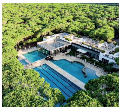
Beheiztes 25 m Schwimmbecken